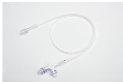
BD Qサイト輸液セット